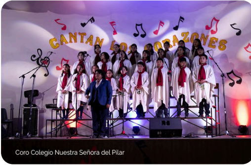
Coro Colegio Nuestra Señora del Pilar

¡Muchas gracias a nuestras queridas alumnas!