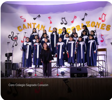
Coro Colegio Sagrado Corazón