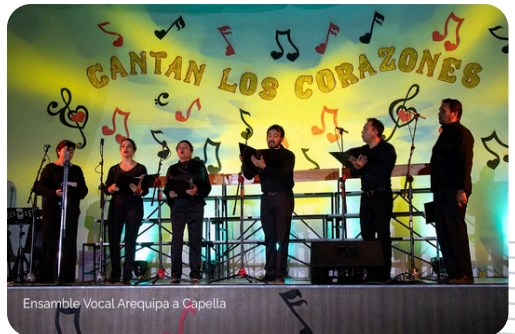
Ensamble Vocal Arequipa a Capella