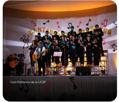
Coro Polifónico de la UCSP